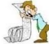
Planning en Prioritering